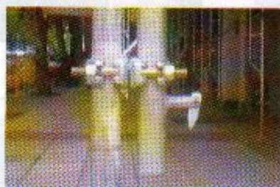
Ejemplo de aplicación de PUA